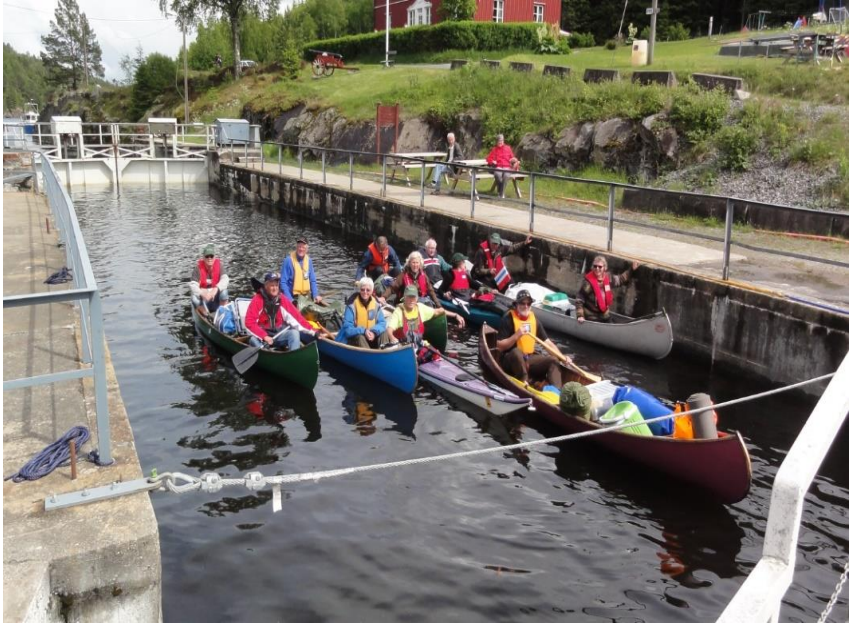
Padling i Haldenvassdraget og slusing av kanoene i Brekke sluser var en sjelden og uforglemmelig opplevelse.

skriver seg fra 1973. Jeg hadde som troppsleder arrangert mange padleturer for speiderne, og de som har hatt ansvaret for 20 – 30 viltre speidergutter på en ukes padletur, vet at dette kan være krevende. Ideen om å invitere selvgående voksne venner med koner/samboere på padletur med overnatting var noe jeg hadde tenkt på i flere år, og i 1974 ved St. Hanstider ble ideen realisert med invitasjon til padletur i Foxen – Stora Le og inn mot Fölsbyn. 12 stk meldte sin interesse, og vi la ut fra Båstnäs 22. juni.