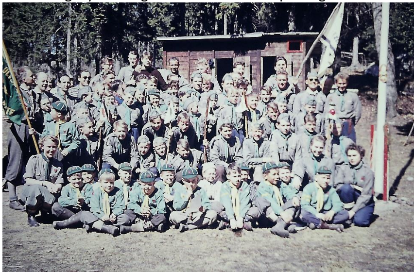
Fra en gruppesamling på Canada tatt enten i 1954 eller 1955. Bildet illustrerer iallfall litt av allsidigheten i 5. Moss på den tiden.

På ny satte speidingen sitt preg på hjembyen Moss i 1963 da man ønsket å blåse liv å planene om å bygge nytt Speiderhus i Nesparken. Ulike sider av speiderarbeidet ble vist i en omfattende utstilling på «Blinken», som da ganske nylig var blitt bygget som tilfluktsrom og ble brukt til ulike kulturaktiviteter. Alt som kunne krype og gå av ulvunger, meiser, speidergutter og speiderpiker, rovere og rangere, samt ledere, var på bena og bidro hver på sin måte til å gi byens borgere et innblikk i hva speidingen innebærer.