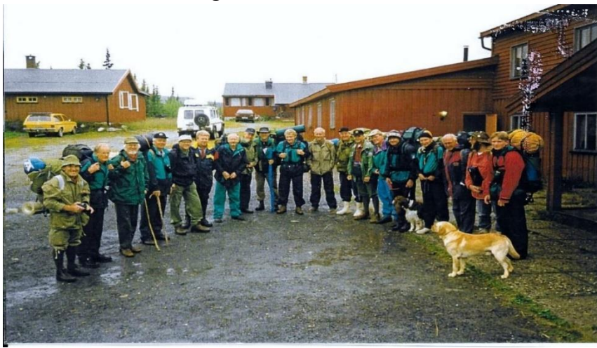
Tradisjonen med årlige Røvertog ble innledet på Sørbekkseter i Vassfaret. Her er hele gjengen samlet før turstart.

Moss er hjertelig velkommen på rovertogene. St. Georgshaikene, derimot, og feiringen av roverlagets jubileer, er kun forbeholdt formelt opptatte rovere. Vi søker år om annet å legge rovertogene til steder nær Moss slik at også eldre rovere og rovere med handikap skal kunne hentes og bringes til fellesmiddagen lørdag, og således føle fellesskapet selv om de ikke lenger er i stand til å ligge i telt eller prestere lange tog. Det kommer vi også til å fortsette med fremover.