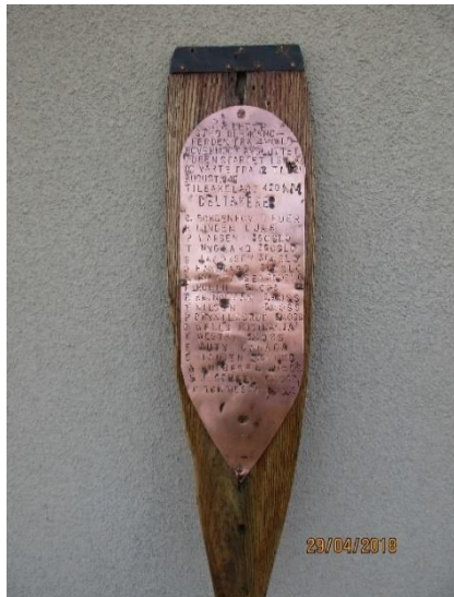
Padleåren med navnene på deltagerne i kanoferden fra Skjåk til Moss i 1949 er restaurert og tatt vare på. Den stod i mange år utenfor gamle Canada.

uhell i Urstrømsfossen ved Barkald. Ny kano ble omgående sendt opp fra Moss, og turen ble fullført etter programmet. I 1951 sto Hallingdalslågen for tur. Etter å ha deltatt i en arbeidsleir ved Tisleia, padlet en gjeng med rovere i ni kanoer, hvorav fire fra 5. Moss, fra Nesbyen til Drammen. Med på en del av turen var NRK's Rolf Kirkvaag, som sendte reportasjer fra kanoen «Gyldne Bever». Turen ble også filmet av Norsk Film. I 1954 ble det også tid til en kortere padletur i Haldensvassdraget.