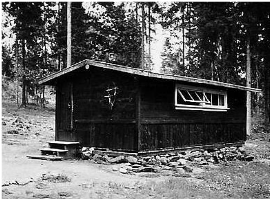
Gamle Canada etterlater seg mange gode minner hos mange