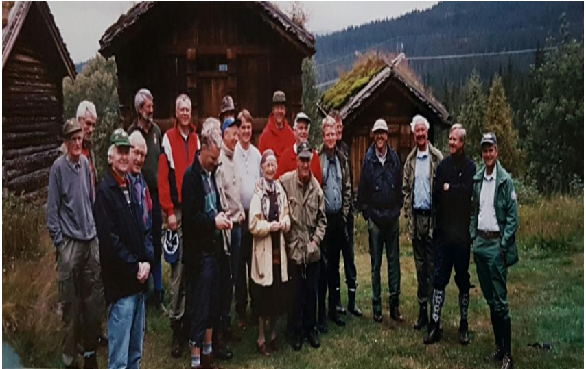
På besøk på Grimdalstunet, hvor billedhuggeren Anne Grimdalen levde og virket.